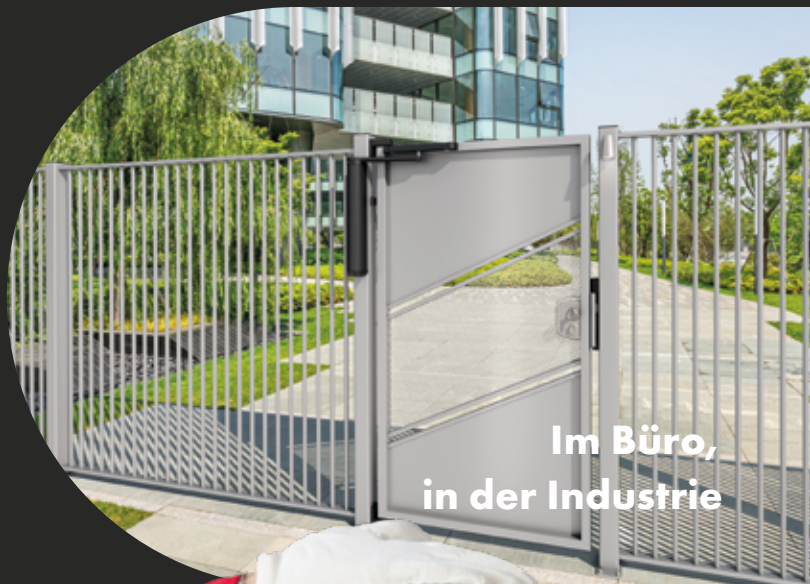
Im Büro, in der Industrie

Kontaktieren Sie uns für weitere Informationen oder um einen Termin zu vereinbaren: