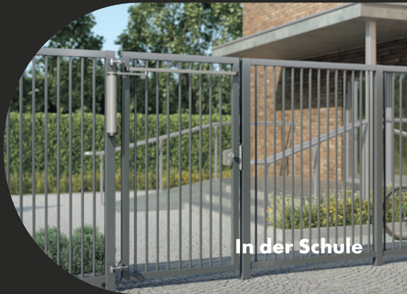
In der Schule