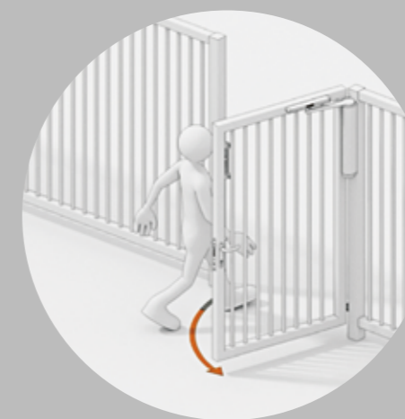
Толкание и движение